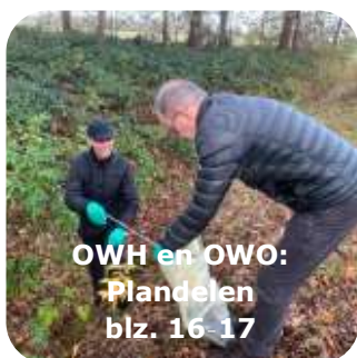
OWH en OWO: Plandelen blz. 16-17