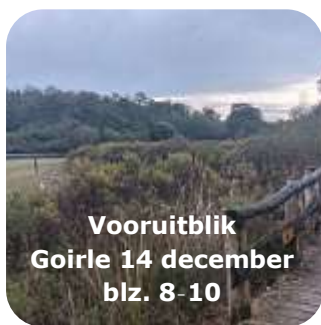
Vooruitblik Goirle 14 december blz. 8-10