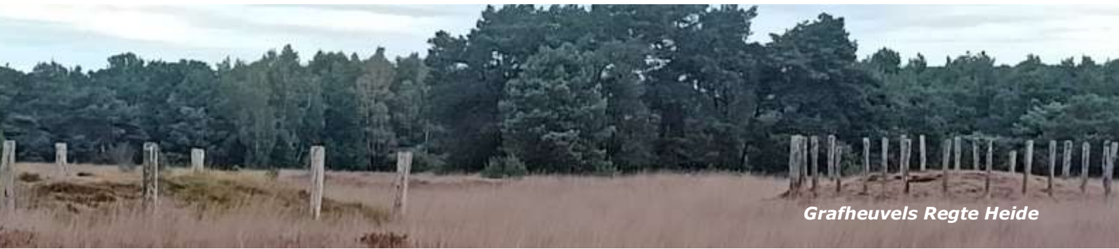
Grafheuvels Regte Heide

De laatste wandeling van de winterserie 2025 start in Goirle. Een opletende lezer zal het begrip 'dagwandeltocht' voorbij hebben zien komen. Maar in deze donkere dagen voor de kerst vind ik 'winterserie' nog wel op z'n plaats. De vroege starters zullen immers bij de start nog geen daglicht zien en misschien zijn de omstandigheden wel winters!