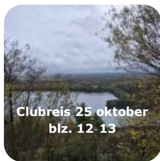
Clubreis 25 oktober blz. 12-13